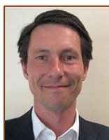
Sami Pirkkala Secretario General de la Comisión Nacional sobre el Desarrollo Sostenible de la Oficina del Primer Ministro de Finlandia

La evaluación es crucial para evaluar el valor y el mérito de las políticas, planes y resultados nacionales relacionados con los ODS. La evaluación puede generar recomendaciones sobre cómo, en qué dirección y con qué rapidez impulsar el cambio para alcanzar los ODS. En contextos de crisis, las evaluaciones pueden contribuir a la agilidad en la respuesta, reorientando las estrategias hacia los ODS más relevantes y ajustando los recursos focalizando a la población en mayor estado de marginación.