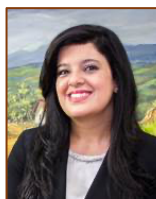
Pilar Garrido Ministra de Planificación Nacional y Política Económica (MIDEPLAN), Costa Rica